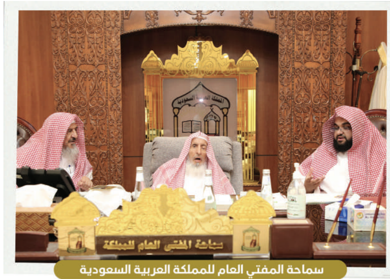
سماعة المفتي العام للمملكة العربية السعودية عبد العزيز بن عبد الله آل الشيخ رئيس هيئة كبار العلماء، رئيس الرئاسة العامة للبحوث العلمية والإفتاء

جهودكم مشكورة لما تقدمونه من تعليم القرآن الكريم لضيوف الرحمن قال صلى الله عليه وسلم خيركم من تعلم القرآن وعلمه وهذه من أعظم المشاريع النافعة التي تقدم لضيوف الرحمن.